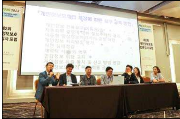
제2회 개인정보보호 전문강사 포럼