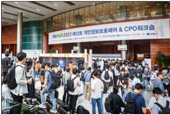
〈개인정보보호 솔루션 시연회 전경-1〉